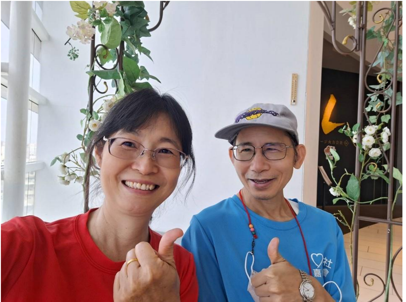
2025. 4. 29 生日前夕，妻子陪我去走一走

話裡頭一起禱告，當我們在許多的相處和問題出現的時候，會找教會的牧者和弟兄姊妹幫忙，他們給我的協助和輔導，減輕了許多的壓力和重擔，這是我們最好的依靠，感謝神的恩典，身為軍眷雖有難處，但也有許多恩典，是靠著主加添給我們的力量，讓我們去學習交託禱告給神，祂是我們隨時的幫助!